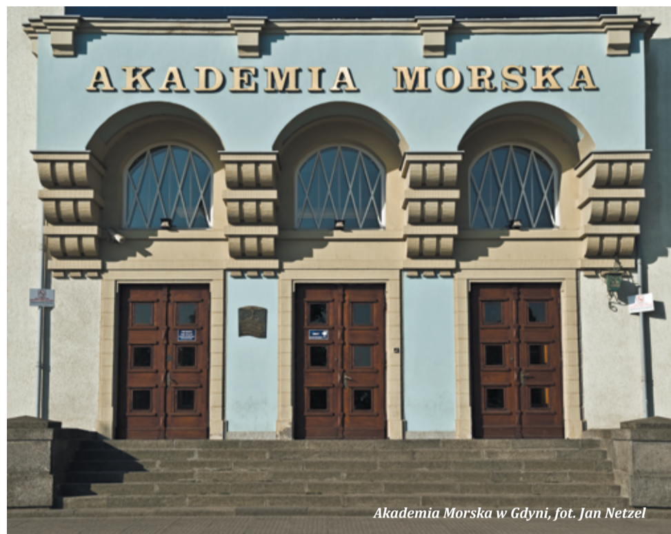
Akademia Morska w Gdyni

Uroczysta inauguracja pierwszego, historycznego roku akademickiego Uniwersytetu Morskiego w Gdyni odbędzie się 6 października 2018 roku.