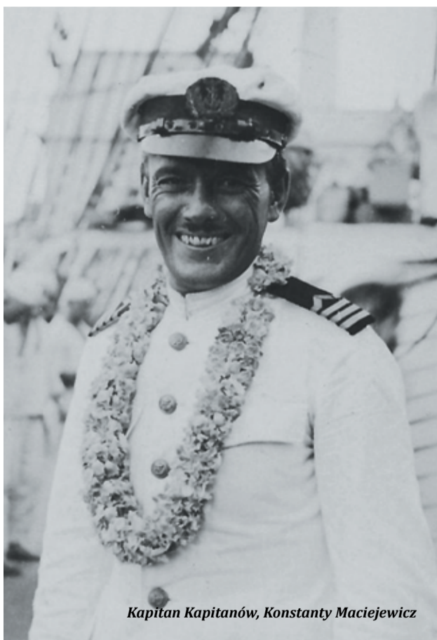
Kapitan Kapitanów, Konstanty Maciejewicz

Jest jedną z legend polskiego szkolnictwa morskiego i biało-czerwonej bandery. Kapitan Konstanty Maciejewicz urodzony na dawnych kresach wschodnich w 1890 roku, marynarskie szlify zdobył w Morskim Korpusie Kadetów w Petersburgu. Praktykę zdobywał na okrętach rosyjskiej marynarki wojennej, m.in. okrętach podwodnych. Podczas pierwszej wojny światowej zasłynął zorganizowaniem udanej próby ewakuacji z zatopionego okrętu podwodnego AG-15.